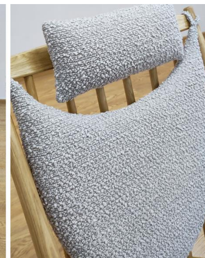
Кресло с подголовником

Ввиду аморфности материала могут быть отклонения в габаритных размерах на \pm 2 см согласно ГОСТ 19917-2014